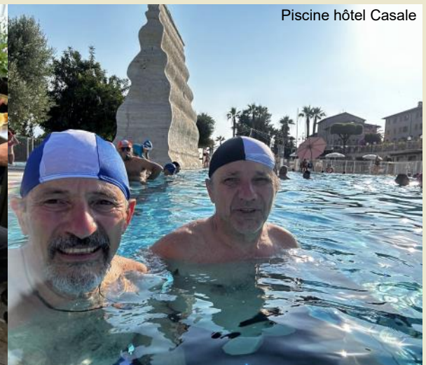
Piscine hôtel Casale