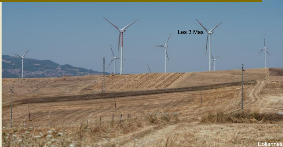
Les 3 Mas