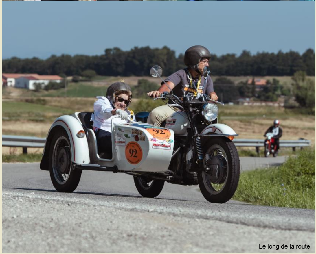
Le long de la route