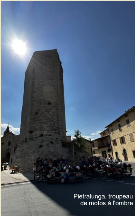
Pietralunga, troupeau de motos à l'ombre