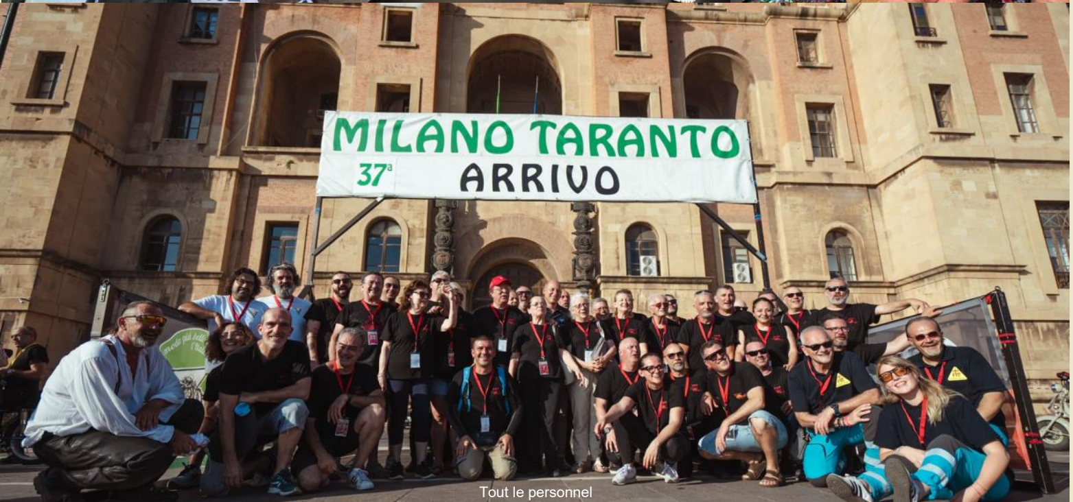
Tout le personnel