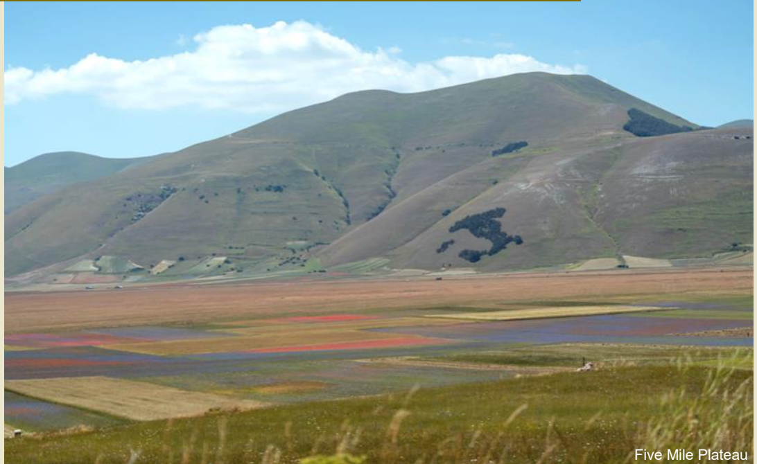
Five Mile Plateau

Les OC de Notaresco, Alanno et Castel di Sangro avec les délices de la région ont été une tâche très difficile pour les dégustateurs : devoir essayer toutes les spécialités afin de donner une évaluation pondérée a mis à rude épreuve leur estomac et leur foie (j'ai oublié que de nombreux participants ont également travaillé dur en tant que dégustateurs...).