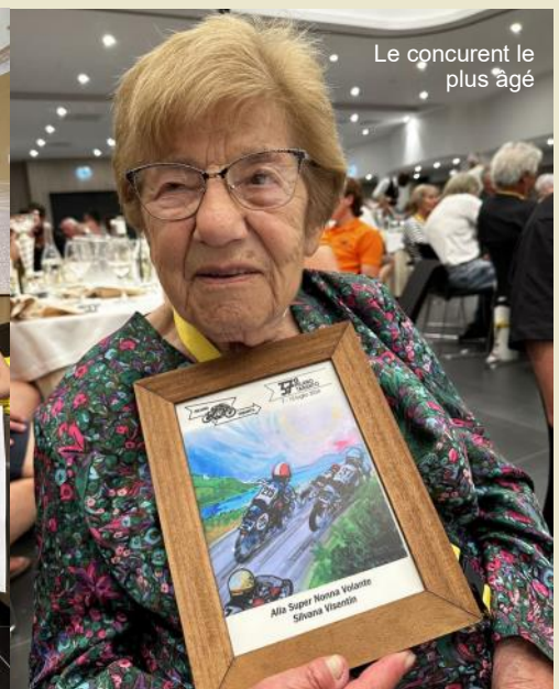
Le concurrent le plus âgé