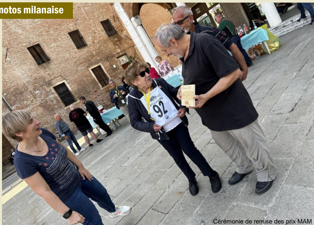
Cérémonie de remise des prix MAM

Les deux OC suivantes ont eu lieu à Alfero et Pietralunga, deux charmants villages des Apennins, avec dégustation de délicieux pains, huiles et truffes dans ce dernier. Arrivée avec le dernier CO à Santa Maria degli Angeli, à côté de la majestueuse basilique, et pour finir