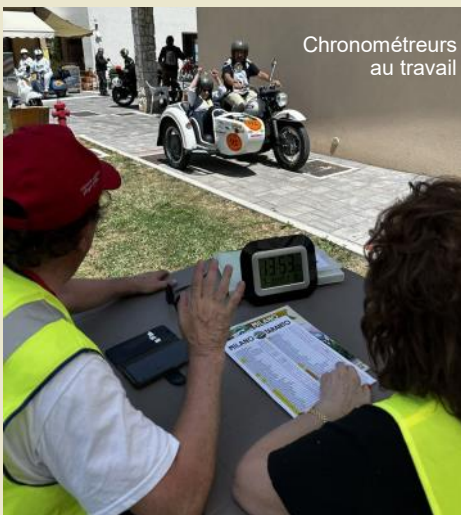
Chronométrateurs au travail