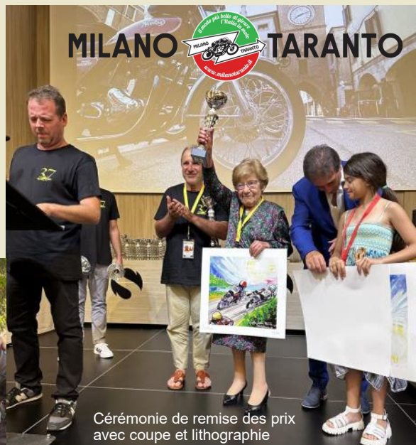
Cérémonie de remise des prix avec coupe et lithographie