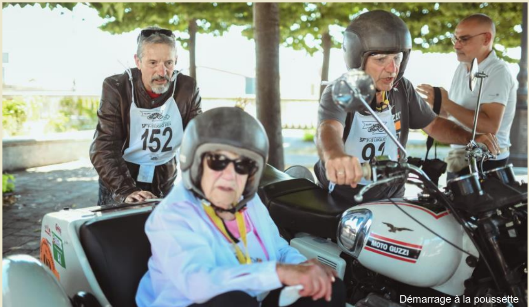
Démarrage à la poussette