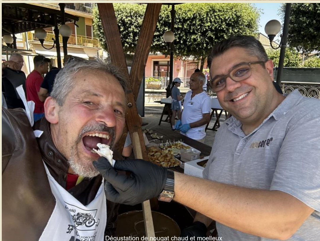
Dégustation de nougat chaud et moelleux

Puis, deux commandants se succèdent rapidement : à Aquilonia avec une reconstitution historique des batailles entre les Souabes et les Maures, et à Lagopescole avant