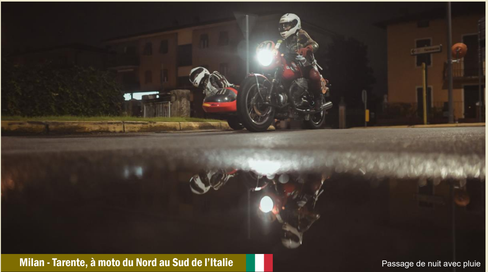
Milan - Tarante, à moto du Nord au Sud de l'Italie