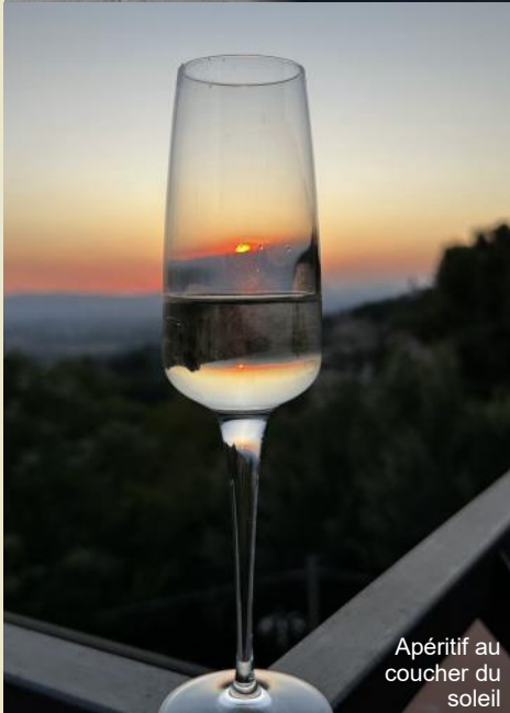
Apéritif au coucher du soleil

Malheureusement, déjà à la fin de cette étape, le V7 de mon frère a commencé à donner des problèmes d'allumage, en commençant seulement par pousser, ce qui lui a ensuite coûté la victoire de classe !