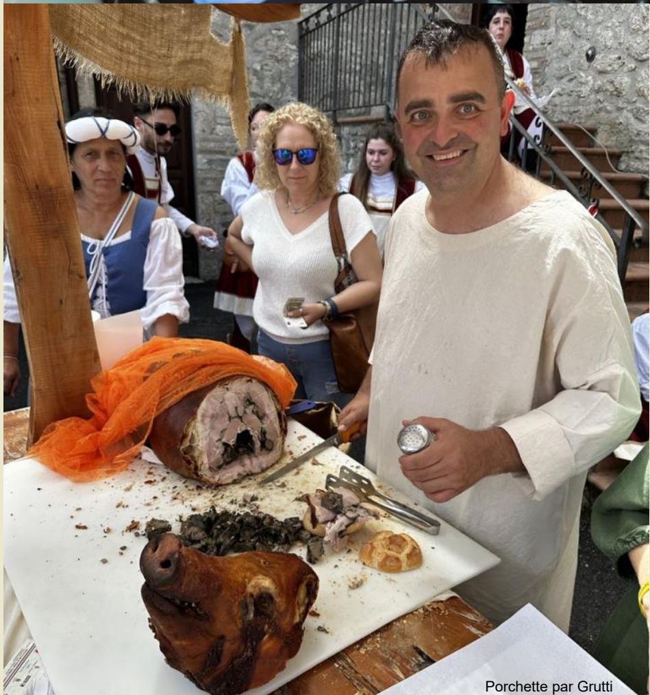
Porchetta par Grutti

Mercredi 10 juillet, troisième étape, seulement 209 km d'Assise à Ascoli Piceno, la plus courte. Départ à 9h. Après seulement une heure, le premier commandant à Grutti, accueilli par le maire, agitant des drapeaux et une porchetta hurlante (troisième place dans les ravi-taillements).